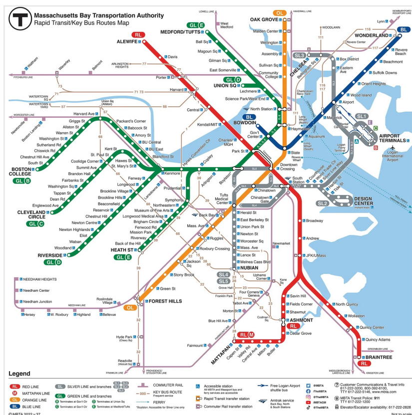
Mapa de la MBTA